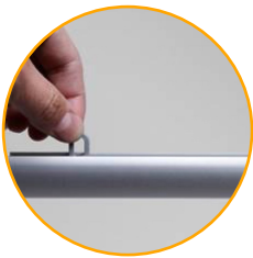
Colgador anti deslizante

Disponibles colgadores y tapones laterales de acabado.