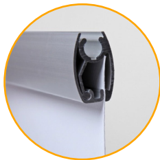
Lateral del perfil