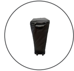
Bolsa de transporte